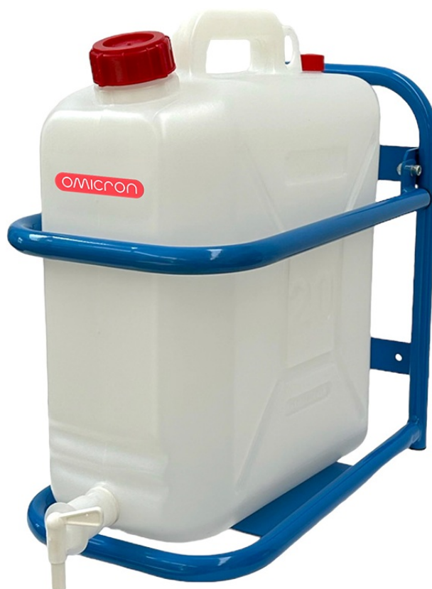
FUSTO 20 LITRI CON RUBINETTO CON SUPPORTO CODICE 2000.56