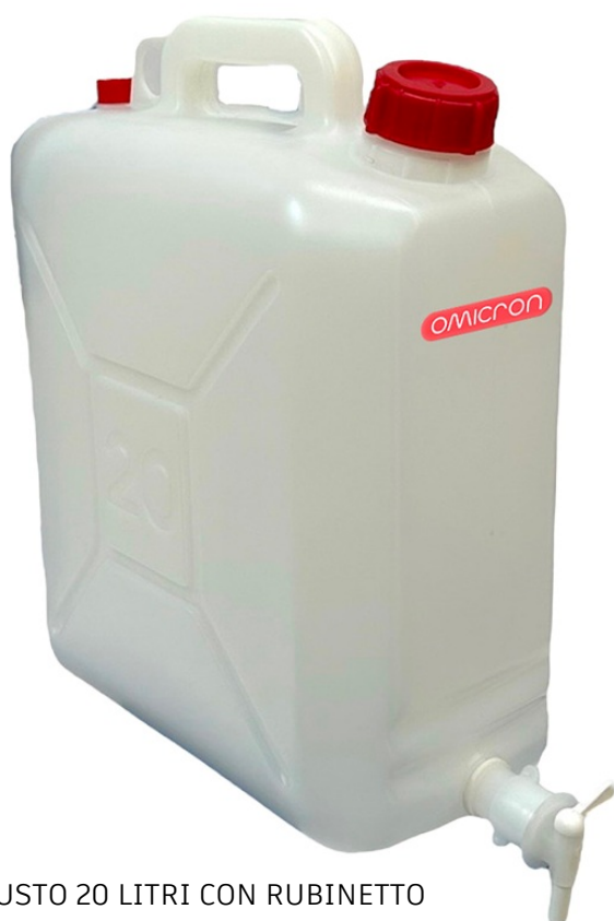
FUSTO 20 LITRI CON RUBINETTO CODICE 2000.A15