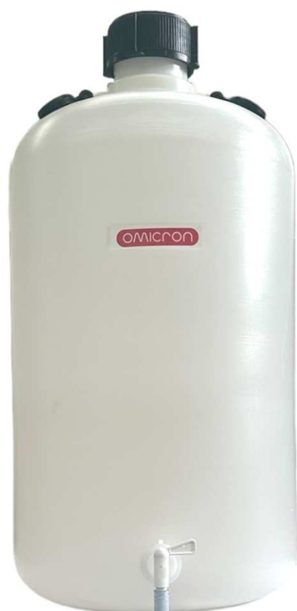
FUSTO LITRI 50 CON RUBINETTO CODICE: 2000.22