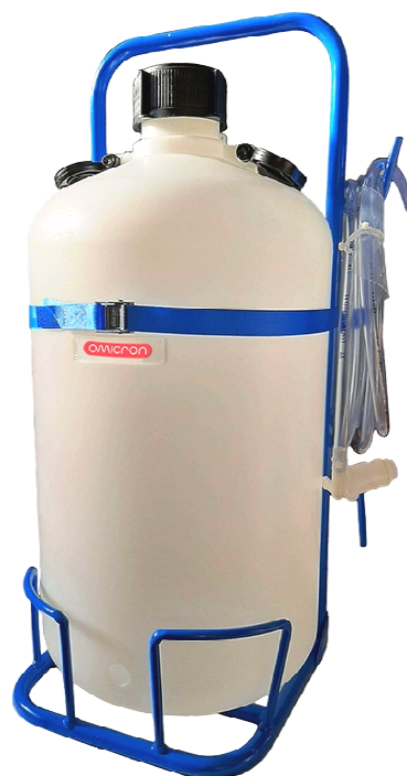
FUSTO LITRI 50 CON RUBINETTO E SUPPORTO CODICE: 2000.22S