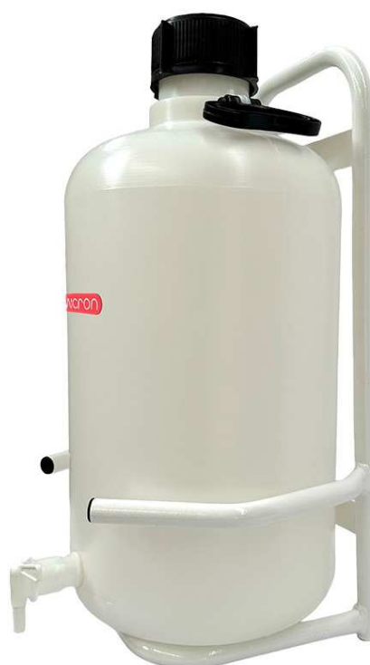
FUSTO LITRI 25 CON RUBINETTO E SUPPORTO CODICE: 4000.11