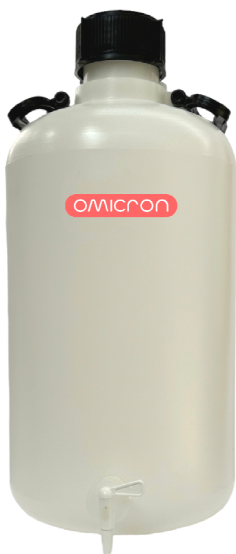
FUSTO LITRI 25 CON RUBINETTO CODICE: 4000.13